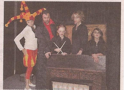
Ein ganz besonderer Faust steht in Oberndorf auf der Bühne.

Weitere Aufführungen: 6., 12. und 13. Oktober jeweils um 20 Uhr sowie am 7. und 14. Oktober jeweils um 15 Uhr. Gespielt wird im Main Kultur House in der Schöffleutgasse 8 in 5110 Oberndorf.