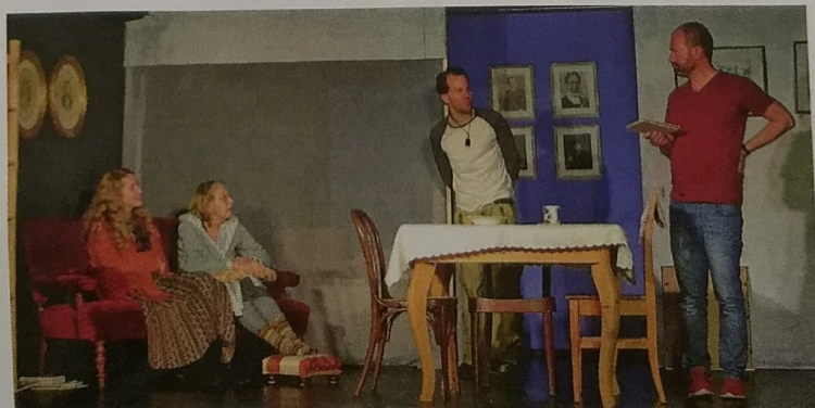
ZUSAMMEN wäre es doch am schönsten, oder?